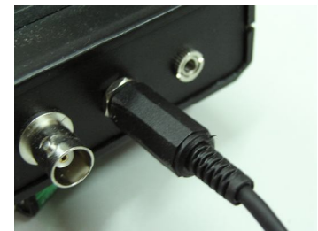
ที่เสียบเครื่องชาร์ต