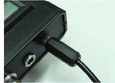
ที่เสียบหูฟัง