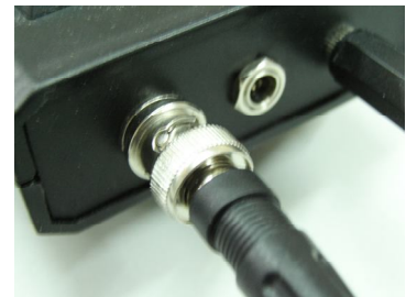
ที่เสียบสายวัดความสั่นสะเทือน