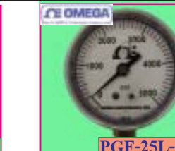
PGF-25L-5000 เครื่องวัดความดันอากาศ หน้าปัดขนาด 2.5 นิ้ว ความแม่นยำ ± 2% ช่วงการวัด 0-5,000 psi ราคาพิเศษ: 2,495 บาท