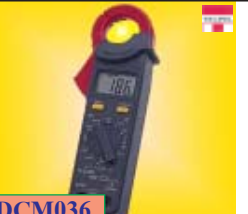
DCM036 300A AC Amp + Frequency Frequency range: ~ 40 kHz. AC/DC Voltage ranges : 20V,600V AC Current ranges : 20A,200A,300A ราคาพิเศษ: 2,816 บาท