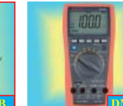
DM 87 DMM measures ACV of frequency converters., VSD-V: 6/60/600/750V. Freq: 5 Hz, 30 MHz. ราคาพิเศษ: 4,495 บาท