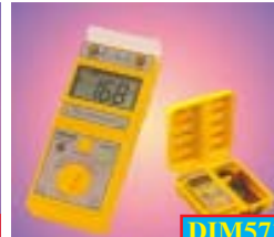
DIM571 Digital Insulation Taster Ranges : 250/500/1000 V. @ : 20/200/2000 Meg Ohms. ราคาพิเศษ: 7,120 บาท