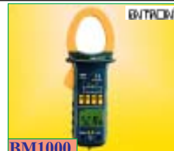
BM1000 แครมมิเตอร์สุดดัดจริต automatically สามารถวัดค่าความต้านทาน ไดร์โอ๊ด แรงดัน กระแสไฟฟ้าได้เป็นต้น ราคาพิเศษ: 1,495 บาท