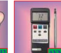
ANV12 HOT WIRE Anemometer Range: 0.2 ~ 20 m/s. Resolution: 0.1 m/s., ราคาพิเศษ: 13,500 บาท