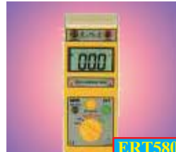
ERT580 Earth Resistance Tester Ranges : 0 - 19.99ohm Accuracy : 1.5%rdg + 2 dgits ราคาพิเศษ: 9,527 บาท