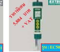
EC500 เครื่องวัด conductivity, TDS, PH Cond.: 0 ~ 199.9/1999 μs/19.99mS TDS: 0 ~ 99.9/999 ppm/9.99ppt ความเค็ม: 0 ~ 99.9/999 ppt/9.99pt pH: 0.00 ถึง 14 pH ราคาพิเศษ: 5,884 บาท + VAT