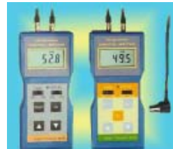
TM8810 เครื่องวัดความหนา รุ่น: TM8810 ช่วงการวัด: 0 ~ 200 μm. ความแม่นยำ: ± 1.5% ± 0.2 ราคาพิเศษ: 9,940 บาท