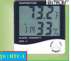
HTC-1 เครื่องวัดอุณหภูมิและความชื้น แบบตั้งโต๊ะ พร้อมนาฬิกา ช่วงการวัด: -50 ~ 70 °C : 10-99% RH. **ราคาพิเศษ: 1,495 บาท