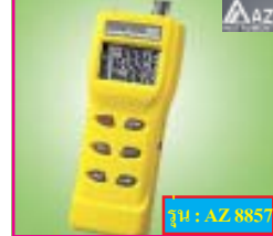
AZ 8857 เครื่องวัดอุณหภูมิ + ความชื้น + อุณหภูมิแอร์ ช่วงการวัด -40 ถึง 500 °C ความละเอียด 0.1 °C **ราคาพิเศษ: 3,996 บาท