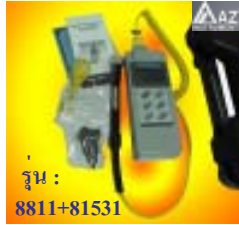
รุ่น : 8811+81531

Waterproof Thermometer รุ่น AZ8811 Thermometer + รุ่น 81531 Miniature Surface Probe ช่วงการวัด : -20 ถึง 400°C.