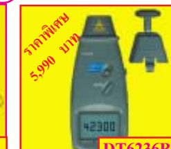
DT6236B มิเตอร์วัดความเร็วรอบแบบ สัมผัส และไม่สัมผัสโดย Laser ในตัวเองกัน รุ่น 6236B ย่านการวัด: 0 ~ 99,999 RPM. Speed: 0 ~ 1,999 m/minute. ราคาพิเศษ: 5,990 บาท