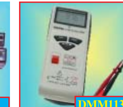
DMM113B Pocket DMM + NCV detector * Non-Contact Voltage * 600V. AC/DC., * NCV: 70V to 600V ราคาพิเศษ: 1,495 บาท