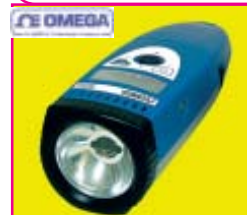
OMEGA HHT41B-KIT High intensity ultra-compact xenon stroboscope, 2 spare lamps, carrying case. ราคาพิเศษ: 24,995 บาท