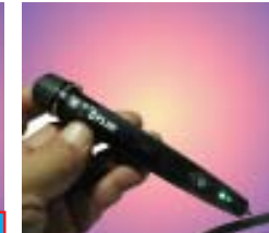
FLIR VP52 Non-Contact Voltage Detector Range : 90 ~ 1000 V. ราคาพิเศษ: 1,900 บาท