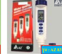
AZ 8371 เครื่องวัดค่าความเค็มในน้ำ แบบปากกา ขนาดพกพ รุ่น: AZ8371 ช่วงการวัด: 1~70 ppt (Nacl) ราคาพิเศษ: 3,996 บาท