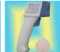
TG-900 เครื่องวัดความหนาของฟิล์มเหล็ก รุ่น: TG-900 ช่วงการวัด: 0 ~ 1,000 μm. ราคาพิเศษ: 7,895 บาท