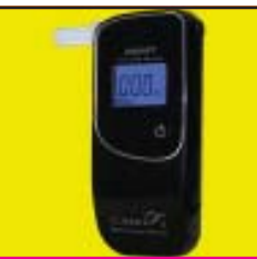
Breath Alcohol Tester CA20FL Accurate Durable Fuel cell Type Measures 0.000 - 0.400% BAC. ราคาพิเศษ: 5,970 บาท