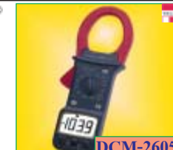
DCM-2605 AC/DC Digital Clamp Meter 1000A. AC/DC+Freq 40kHz Resistance to 200 kΩ Wire dia.: φ 57mm ราคาพิเศษ: 4,995 บาท