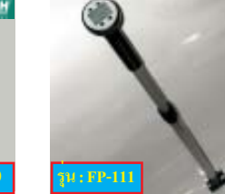
FP-111 GLOBAL Water Flow Probe วัดอัตราการไหลของน้ำในแม่น้ำ, เขื่อน, น้ำในท่อน้ำ, บ่อน้ำทิ้ง และอื่น ๆ ความยาวถึง 6 ฟุต ช่วงการวัด: 0.1 to 4.5 เมตร/วินาที