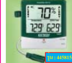
445815 เครื่องวัดอุณหภูมิ + ความชื้น + Dew Point. ช่วงการวัด: -10 ~ 60 °C., 10 ~ 99% RH. Audible/Visual Alarm. ราคาพิเศษ: 02-503-8900