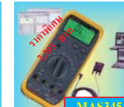
MAS345 ดิจิตอล มัลติมิเตอร์ แบบเปลี่ยน Range อัตโนมัติ พร้อมซอฟต์แวร์คอกอมป. AC/DC.V: 4 ~ 1,000V, 0 ~ 750°C., AC/DC.A: 4m-10A, Ohm: 40MΩ ราคาพิเศษ: 2,395 บาท