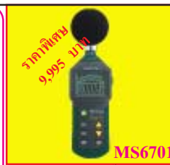
เครื่องวัดระดับเสียงพร้อม ซอฟต์แวร์และคอกอมป., ย่านการวัด: 30 ~ 130 dB *Include Calibration Certificate ราคาพิเศษ: 9,995 บาท