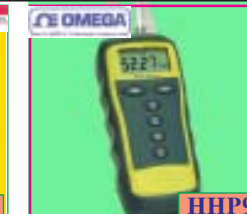
HHP90 เครื่องวัดความดัน (Manometer). Range: 0 ~ 130 mBar. Multiple units : inH2O, mmH2O, mbar, psi, kPa, inHg, mmHg. ราคาพิเศษ: 11,495 บาท