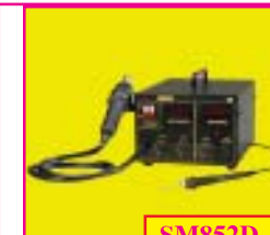
SM852D เครื่องเป่าลมร้อนพร้อมหัวแรง HotAir Wk. Station: 700 W., Soldering Iron: 60 W. Temp. Range: 100 - 480 °C ราคาพิเศษ: 3,995 บาท