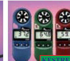
KESTREL เครื่องวัดความเร็วลม Special KESTREL 1000 : 4,995 บาท KESTREL2000: 5,995 Baht KESTREL3000: 8,995 Baht