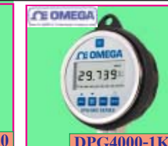
DPG4000-1K Very High Accuracy เครื่องวัด ความดัน ความแม่นยำ ± 0.05% FS ช่วงการวัด: 0 to 60 bar, kg/cm 2 , kPa, mbar ต่อเข้าคอมพิวเตอร์ได้ โดยใช้สาย RS232 ราคาพิเศษ: 2,495 บาท